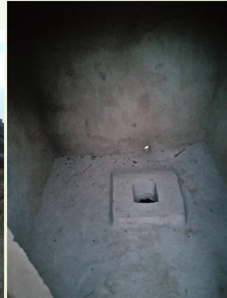
Latrine Ogol Dah