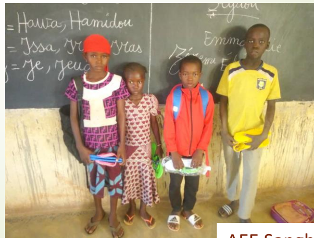
AEE Sangha – remise de kits d'hygiène et chaussures