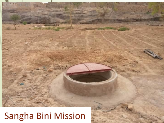
Sangha Bini Mission