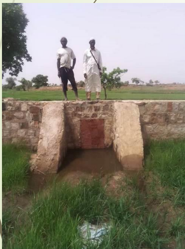
Barrage de Sasabelou terminé