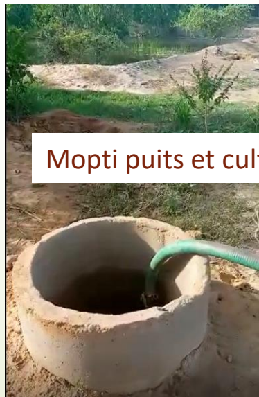
Mopti puits et cultures