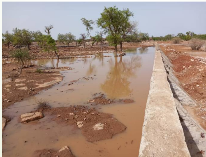
Barrage de Komguiiri – premier remplissage