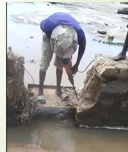
Wadiouba Tene Echancrure pour changement de vanne