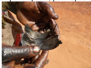
pendant plusieurs jours.

- 23h30 arrivée à Sévaré « au petit repos », petit repas réparateur et bonne douche... Je ne veux plus entendre parler du fourgon