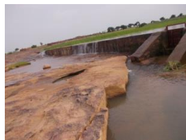
Diaboro Sangha bini