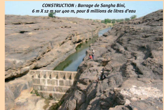
CONSTRUCTION : Barrage de Sangha Bini, 6 m X 12 m sur 400 m, pour 8 millions de litres d'eau