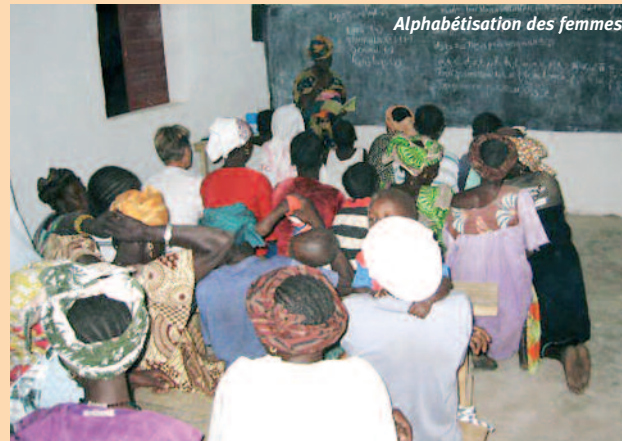
Alphabétisation des femmes