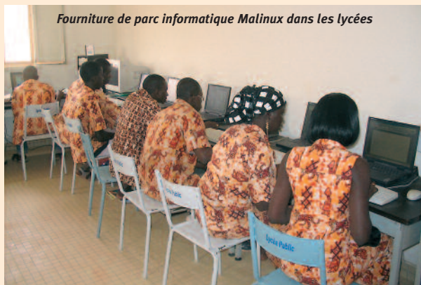
Fourniture de parc informatique Malinux dans les lycées